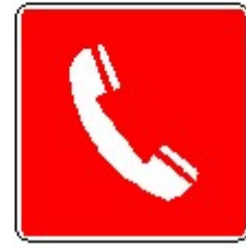
Telefono per interventi antincendio